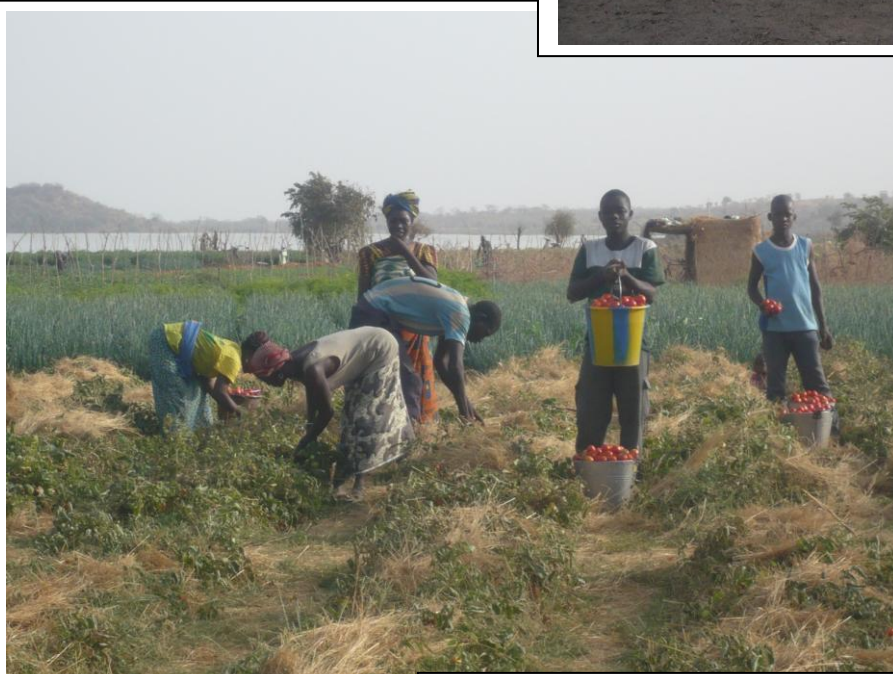
Récolte des tomates Barrage et lac de retenue en arrière plan