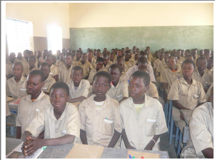
Le centre d'alphabétisation : La classe de sixième : 130 élèves dans la même classe !

La tradition veut que le touriste « solidaire » plante son arbre comme le signe durable de sa présence et son gage d'amitié.