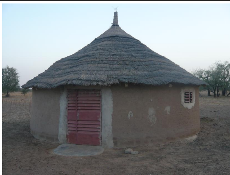
Case « hébergement »